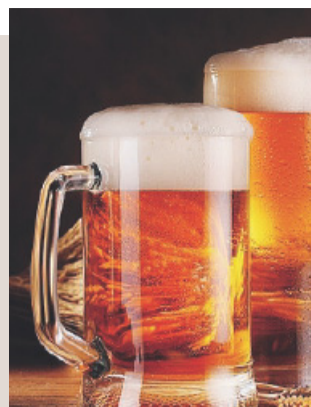
BIRRA Tre giorni di festa