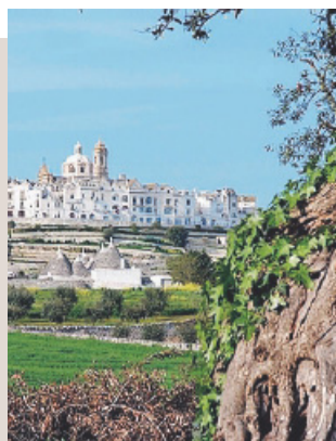
LOCOROTONDO Una veduta