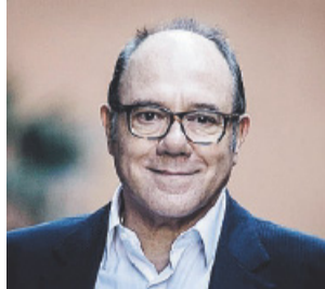
OGGI Carlo Verdone